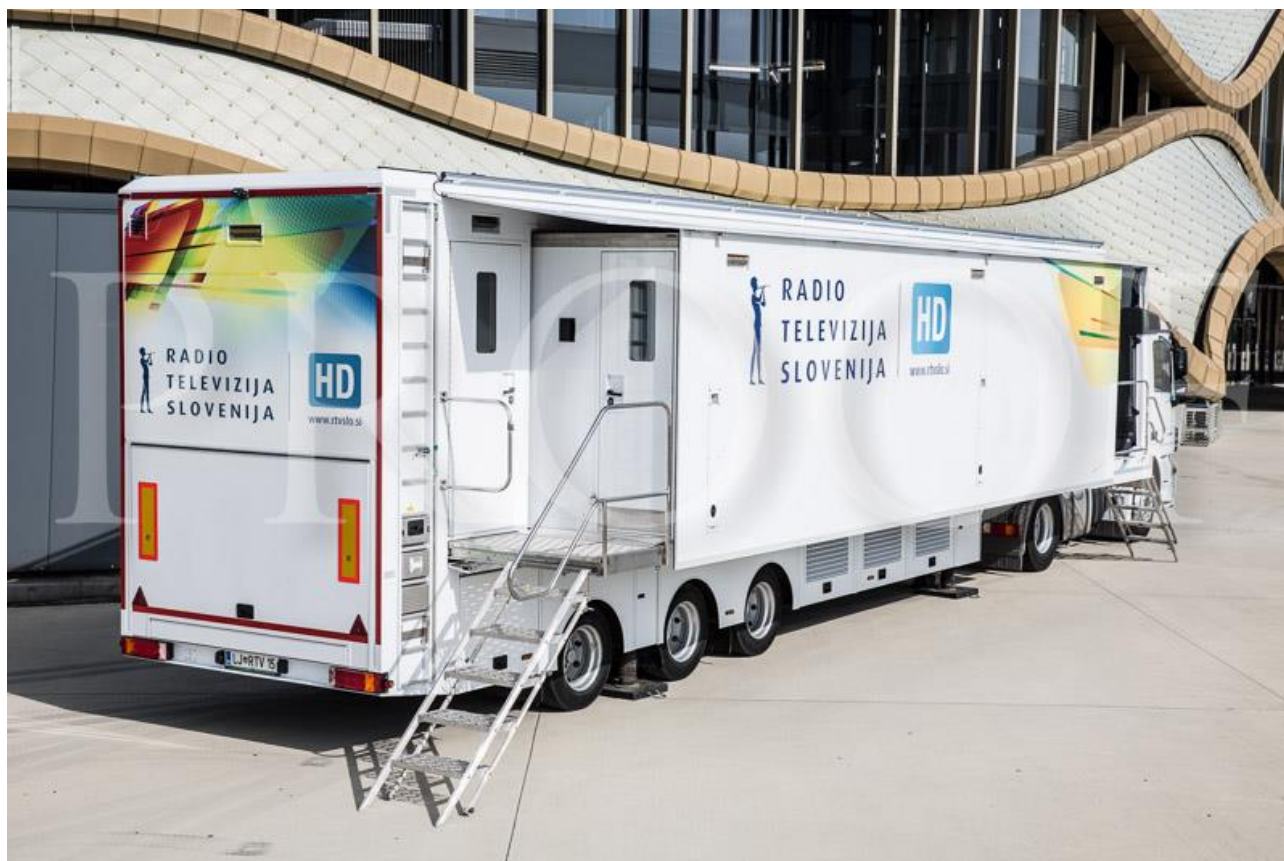
Slika reportažnega vozila HD-1