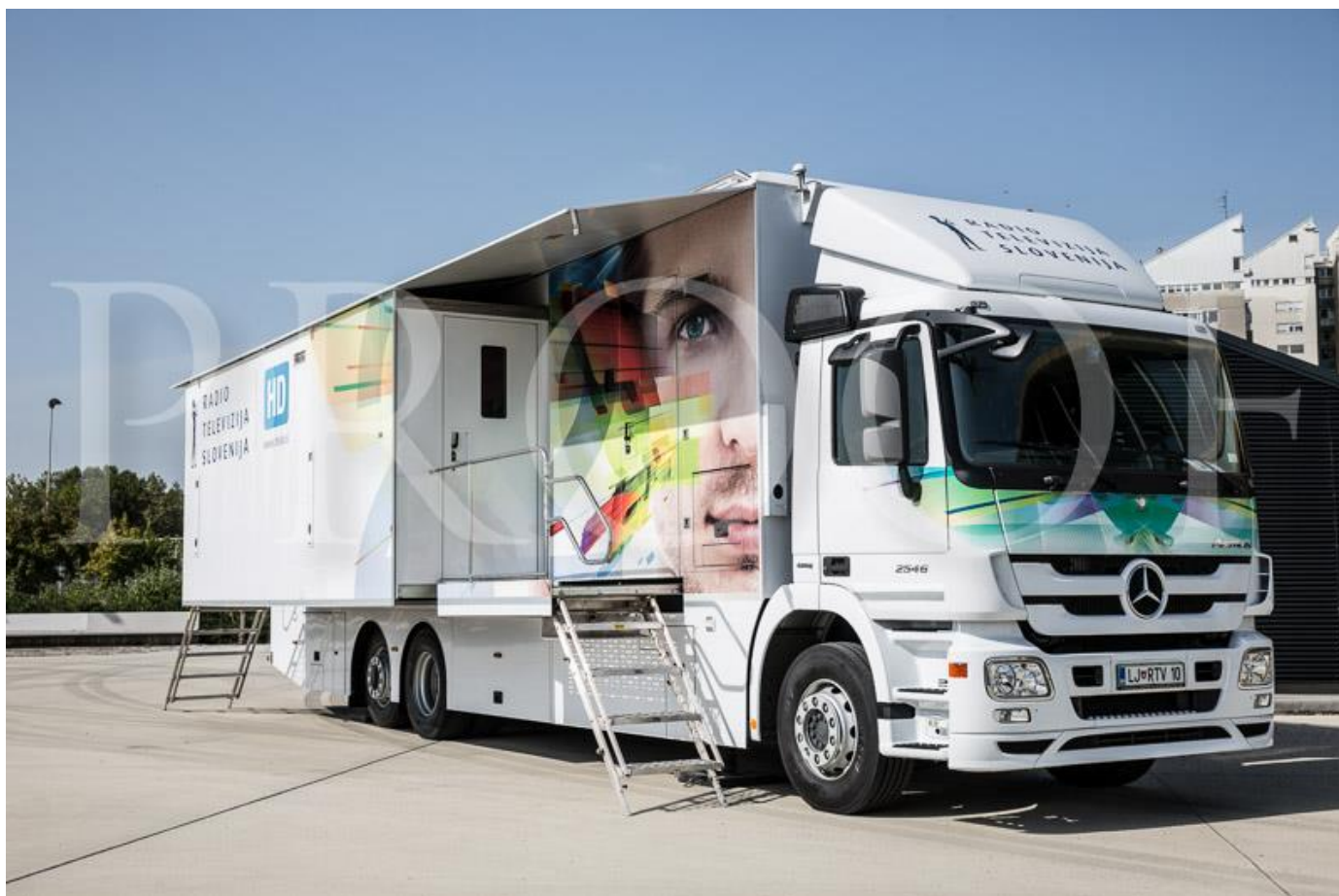
Slika reportažnega vozila HD-2

Reportažno vozilo HD-2 je tovornjak, in je dolgo 12 metrov, široko 2,55 metra z ekstenzijo je široko 6 metrov in visoko 4 metre. Teža vozila je 15 ton. Potrebna električna napetost 1 x CEE 63A -5pin, 400V (3 faze). Reportažno vozilo deluje v video formatu 1080i/50, Audio pa deluje v Stereu in Dolby E. V priložnosti spodaj so slike in layout prostora reportažnega vozila. Cena najema osnovne konfiguracije, je prikazana v spodnji tabeli za HD-2. Spodnja konfiguracija je osnovna, cena se povečuje z povečanjem kamer ter druge tehnične opreme, ekipe reportažnega vozila.